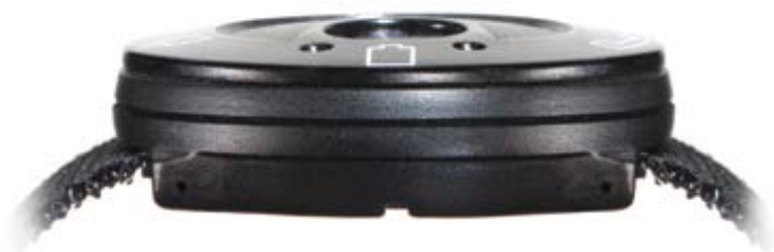
Fem tydelige symboler.

En nyhet i systemet er den unike Lynx MiniVib. En diskret og trådløs varslingsenhet som du for eksempel kan ha på armen og som holder deg trygt informert.