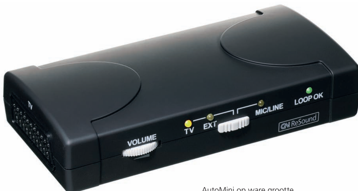
AutoMini op ware grootte

AutoMini is compact en kan eenvoudig worden meegenomen naar uw vakantiebestemming. U kunt AutoMini met de bijgeleverde accessoires aansluiten op elke televisie waar u naar kijkt, bijvoorbeeld in de caravan. U kunt uw eigen volume kiezen zonder iemand te hinderen en u kunt ongestoord luisteren.